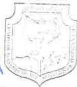
PROFRA. OFELIA DEL CASTILLO GUILLEN PRESIDENTE MUNICIPAL